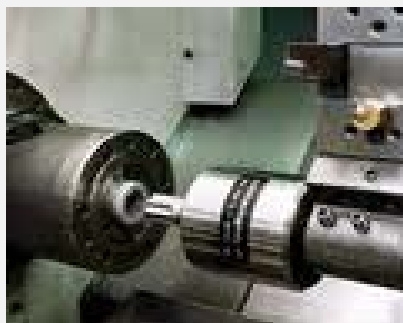
Χρήση σε τόρνο (cnc ή συμβατικό)