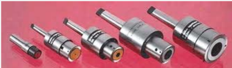
Σειρά εργαλείων για εξωτερική μορφή.