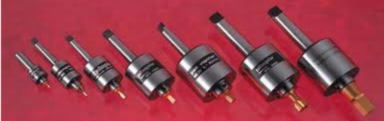
Σειρά εργαλείων για εσωτερική μορφή.