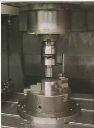
Χρήση σε φρέζα και δρόπανο (cnc ή συμβατικό)